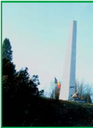
Mémorial des Chasseurs

circuit transfrontalier de 14 km- parcours difficile